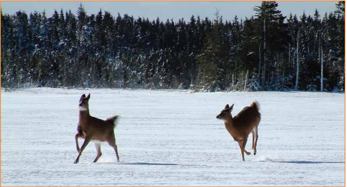
Hirsche galoppieren auf Norbert und mich zu...