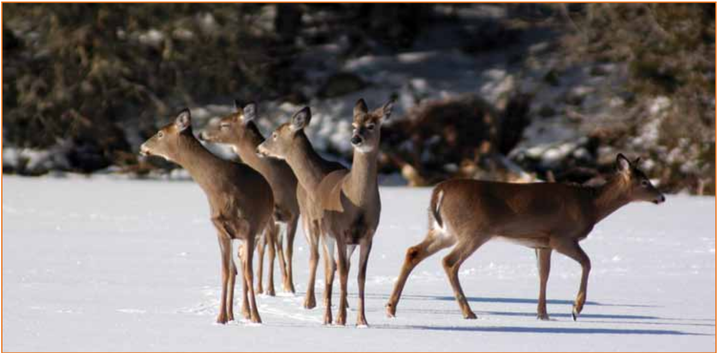
Weißwedelhirsche auf dem St. Esprit Lake direkt vor unserer Fotohütte