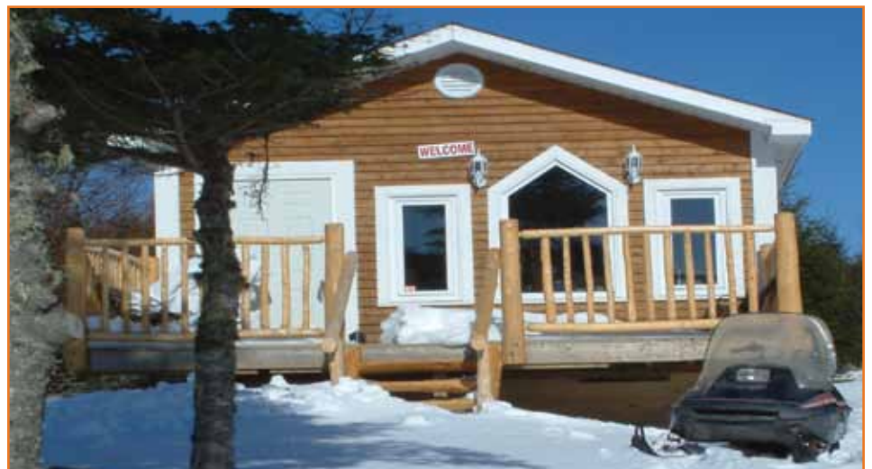
Unsere Ferienhütte mit Motorschlitten

Es gibt in der englischen Sprache ein Sprichwort "There is safety in numbers" (Sicherheit ergibt sich durch größere Anzahl). Dieses Sprichwort gab uns die zweite Erklärung für die Verhaltensweise der Hirsche.