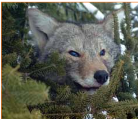
Kojote am St. Esprit Lake

erstreckt. Mein Sohn und ich haben hier viele Abenteuer erlebt und sind der Familie Vetter sehr dankbar für die vielen guten Fototipps und das Vermieten der Hütten. Ein Erlebnis, das ich als „Kanada pur“ bezeichnen möchte. Unsere Fotos geben hoffentlich einen kleinen Einblick in unsere vielfältigen Abenteuer.