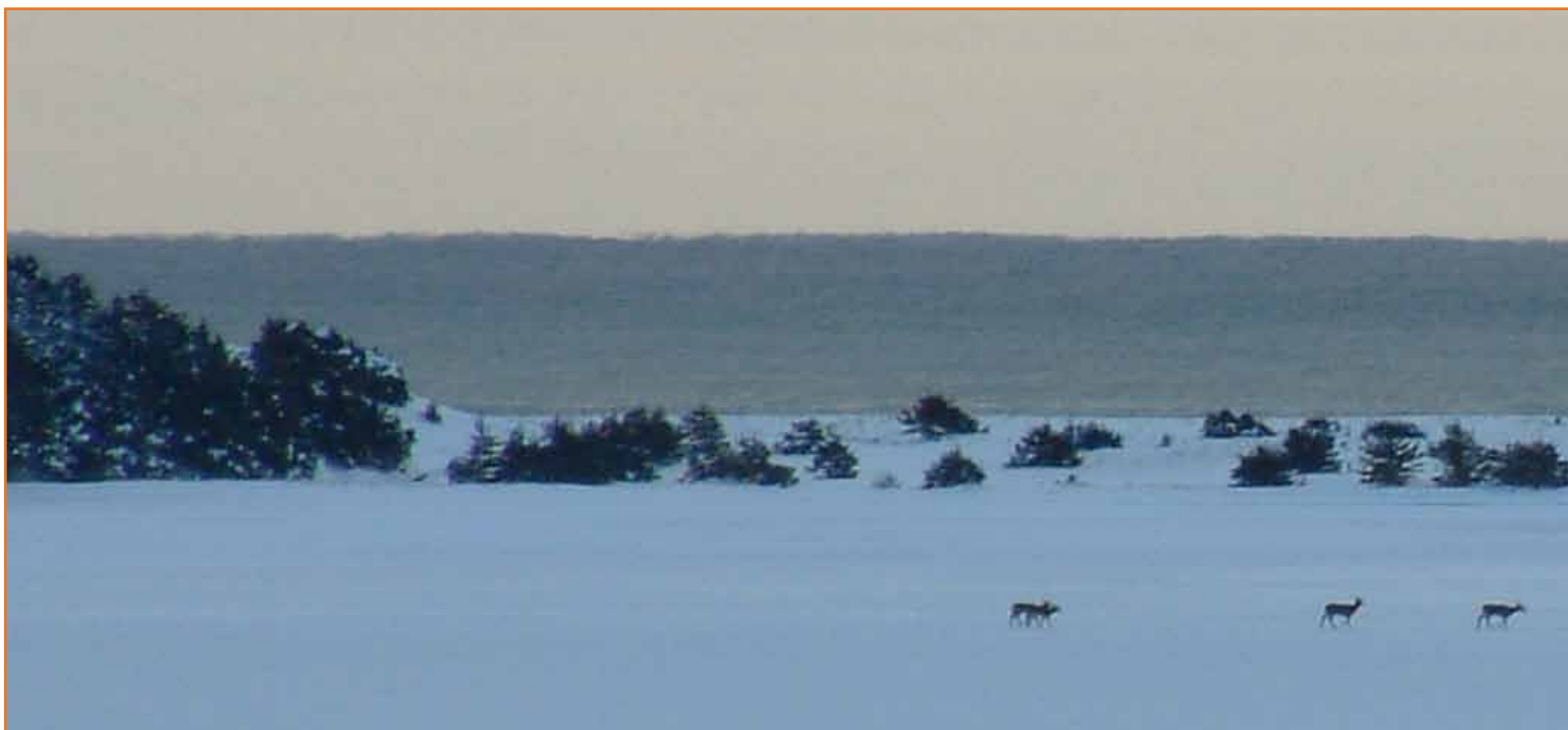
Ausblick von Vetter's Ferienlodge auf den St. Esprit Lake, Sandstrand und Atlantik

Als ich 1987 im Alter von 21 Jahren als Immigrant in Kanada am Halifax-International-Airport ankam, war meine Fotoausrüstung auf eine kleine Kamera beschränkt. Natürlich gab es damals auch noch keine digitalen Kameras, und so hat meine Tierfotografie in den ersten 10 Jahren nach meiner Auswanderung bei weitem nicht die Ergebnisse erzielen können, die ich mir eigentlich erhofft hatte. Bis 1998 ergab sich oft schon die Gelegenheit, Elche in Cape Breton sowie einige Adler fotografieren zu können. Als ich es mir dann 1998 endlich leisten konnte, bessere Kameras einzusetzen, habe ich mich natürlich noch vermehrt um Motive von anderen Tierarten wie z.B. Weißkopfseeadlern, Schwarzbären, Kojoten und Weißwedelhirschen bemüht. Nachdem ich nun über 20 Jahre auf Cape Breton, Nova Scotia, wohne und viel fotografiere, habe ich natürlich