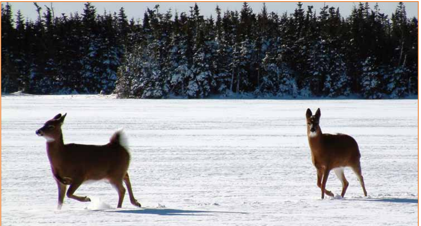
Die Kojoten geben auf...