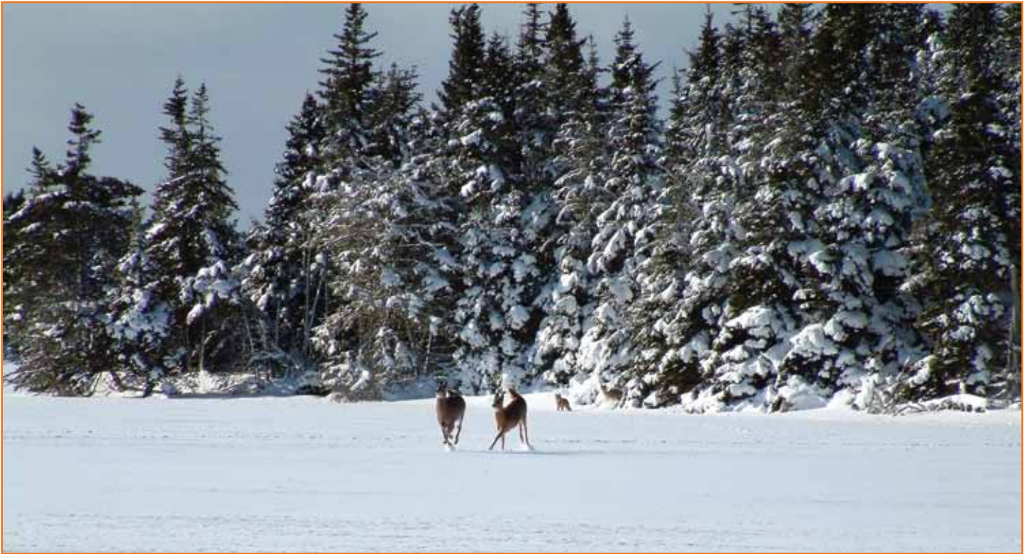
Kojoten treiben die Weißwedelhirsche auf den See...