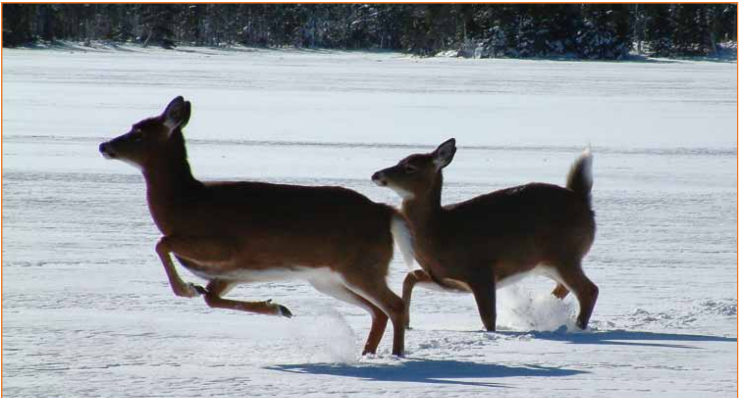
In der von den Kojoten verursachten Panik nehmen uns die Tiere erst 10 Meter vor der Kamera wahr...