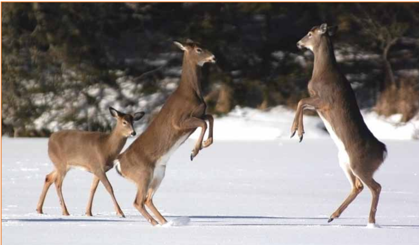
Weißwedelhirsche beim Spielen in nur 10 Meter Entfernung von unserer Fotohütte

Die beste Möglichkeit, Jungtiere vor Kojoten zu schützen, besteht darin, in Herden von 5 bis 20 Tieren zusammenzubleiben. Besonders nach starken Schneefällen versacken Weißwedelhirsche in Waldgebieten im Neuschnee. Der See ist allerdings durch den Wind meist von Schnee leergefegt, und daher können hier die Weißwedelhirsche vor den Kojoten flüchten. Dieses gilt besonders für die Sandstrände entlang